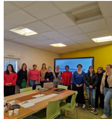
Ateliers animés par nos experts bénévoles