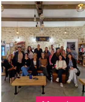
Marraines du Club Fémin'In

Sur le terrain, Initiative Ouest Provence est bien plus qu'une structure d'appui : elle est l'alliée du quotidien pour les entrepreneurs. En proposant un accompagnement à la fois humain et financier — écoute, conseils, mise en réseau, sécurisation des parcours, accès à des financements — nous transformons les idées en projets solides et les projets en réussites durables. Forces vives de l'écosystème local, les membres de l'association contribuent activement à faire émerger une dynamique entrepreneuriale plus inclusive, résiliente et ancrée dans le territoire.