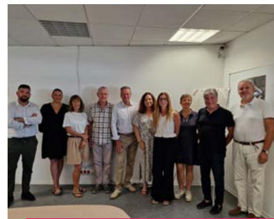
Membres du comité d'agrément Initiative Ouest Provence